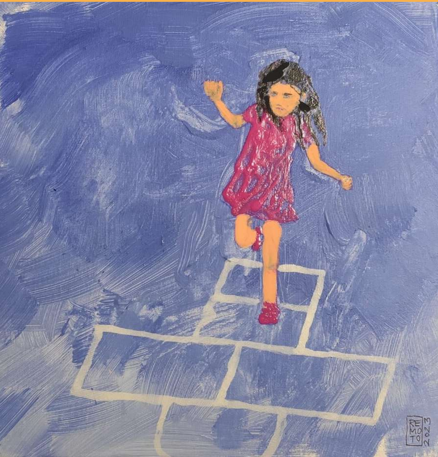
Oil painting on canvas 100 x 70 cm