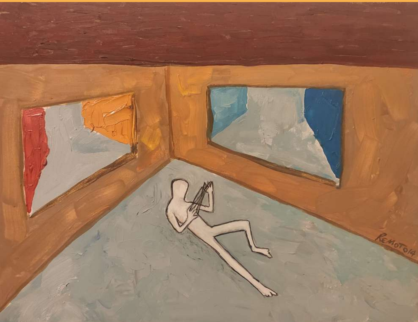
Oil painting on cardboard 50 x 30 cm