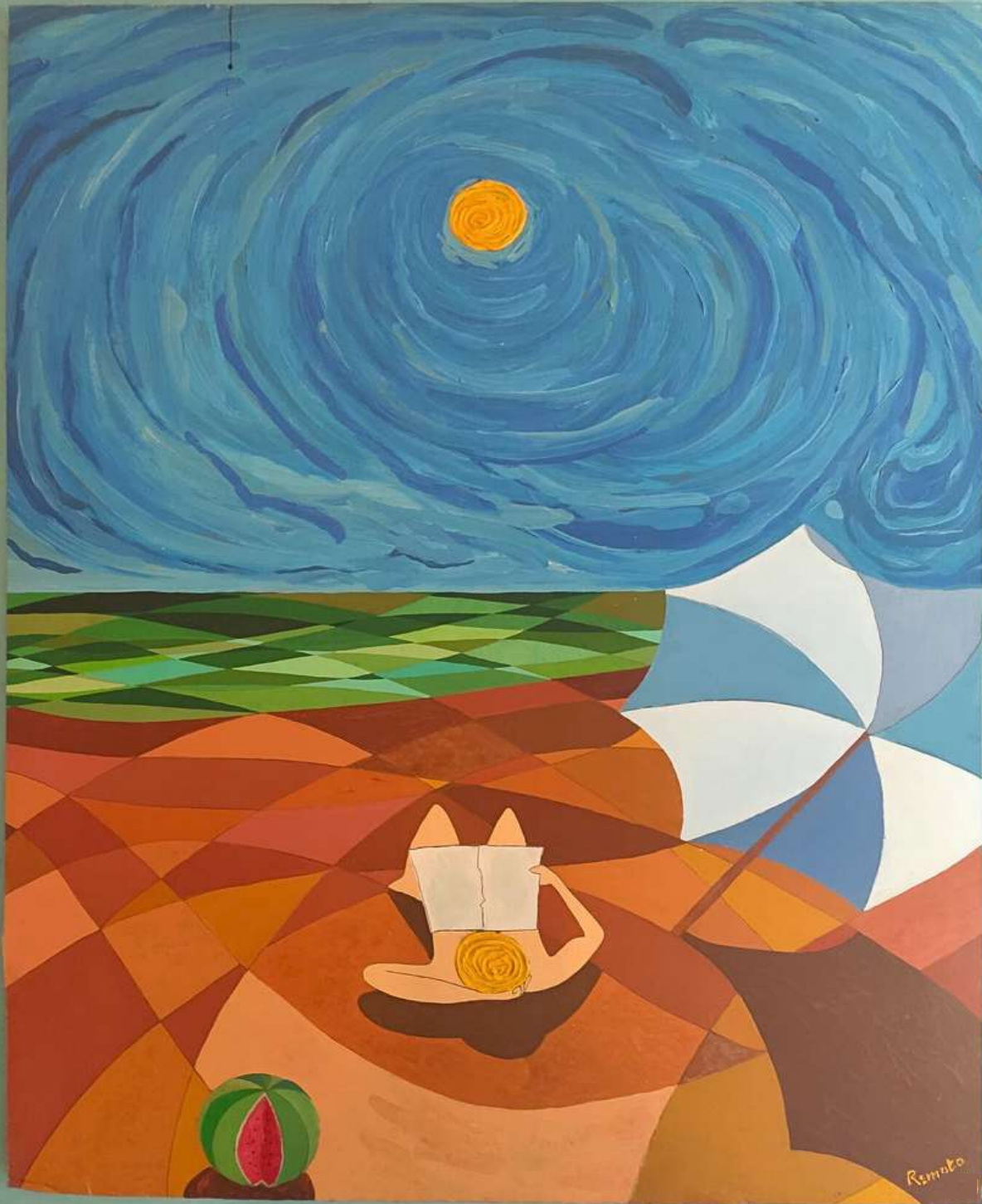
Oil painting on cardboard 120 x 100 cm