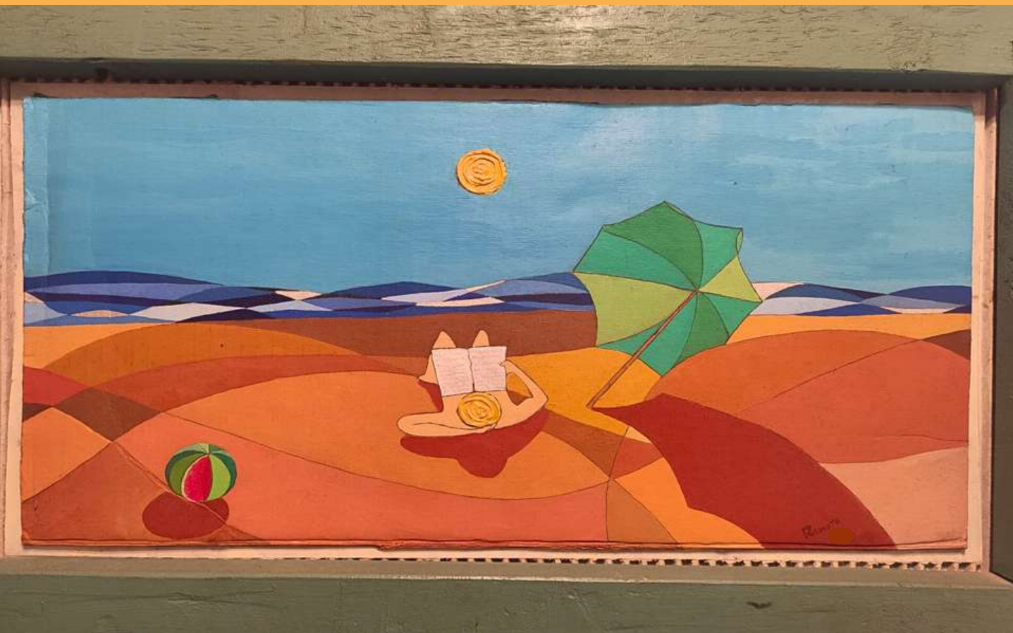
Oil painting on cardboard 60 x 25 cm