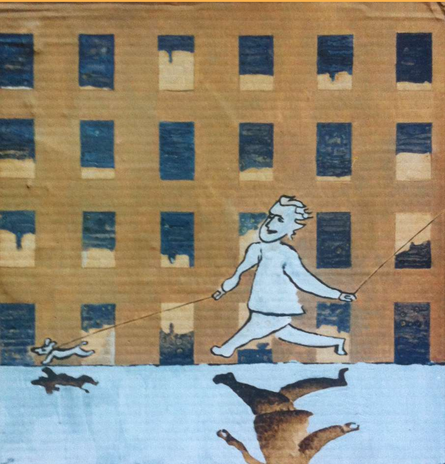
Oil painting on cardboard 40 x 40 cm