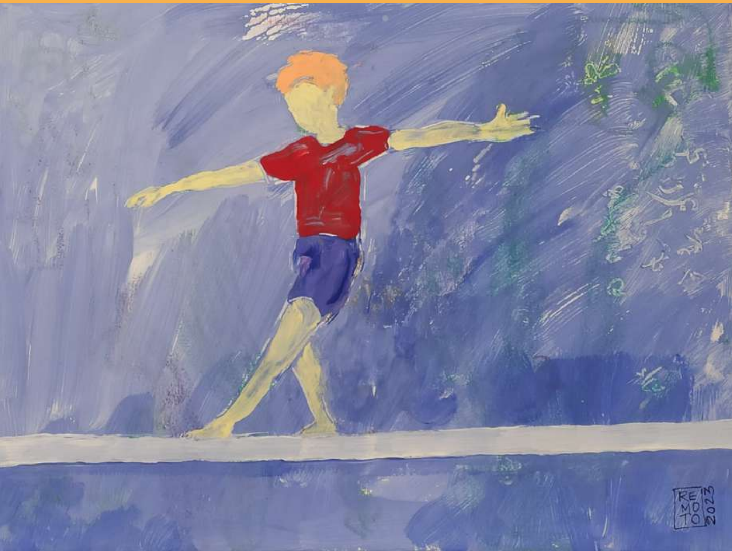
Oil painting on canvas 100 x 70 cm